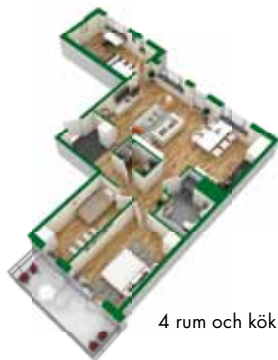
4 rum och kök ca 95 kvm