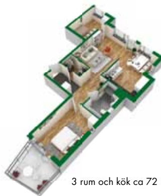
3 rum och kök ca 72 kvm