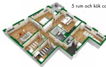
5 rum och kök ca 122 kvm