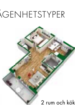
2 rum och kök ca 69 kvm