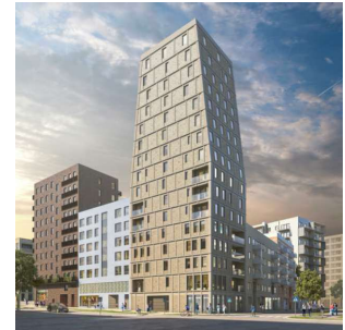
Visualisering. Avvikelser kan förekomma.