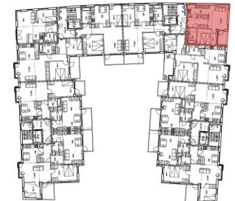
Läge på planet