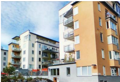
Vy över kvarteret