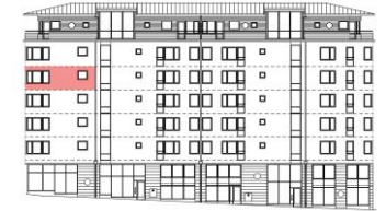
Fasad mot norr

Vi reserverar oss för att mått på ritningen kan ha mindre avvikelser.