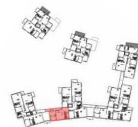
Läge på planet