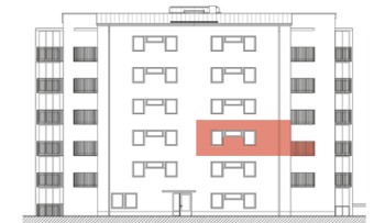
Fasad mot nordost

Botrygg förbehåller sig rätten för mindre avvikelser.