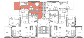
Läge på planet