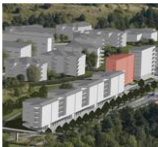
Vy över kvarteret

Lgh nr: 1532 1 rok – 36 kvm Våningsplan: 3